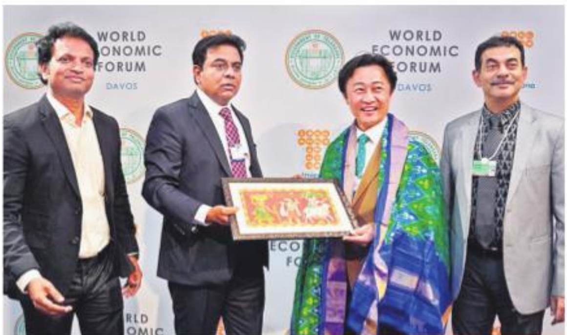
హ్యూందాయ్ సీఈవో యాంగ్ గ్యోవికి జ్ఞాపకపత్రం అందజేస్తున్న మంత్రి కేటీఆర్

ప్రముఖ కార్ల తయారీ సంస్థ హ్యూందాయ్ తెలంగాణలో రూ.1,400 కోట్ల పెట్టుబడి పెట్టుకుంటున్నట్లు ప్రకటించింది. దానోసలో మంత్రి కేటీఆర్ తో సమావేశమైన హ్యూందాయ్ సీఈవో యాంగ్ గ్యోవి పెట్టుబడులపై ప్రకటన చేశారు.